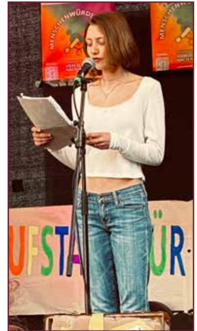
Schüls gegen RECHTS waren zahlreich auf der Demo vertreten..

Einen Tag vor der Landtagswahl, am Samstag, den 7. März 2026, fand in Heidelberg eine Demonstration gegen Rechtsextremismus statt. Schon zum dritten Mal hatte Bündnis »Kein Schritt nach Rechts Heidelberg« so eine Veranstaltung organisiert. Nun hieß das Motto »Aufstand für Anstand – Demonstration für Demokratie und gesellschaftlichen Zusammenhalt.« Die Stimmen des KlimaProtestChor Heidelberg ertönten an Schwanenteichanlage bereits vor der eigentlichen Kundgebung. Bei strahlendem Sonnenschein, verstärkt durch eine Lautsprecheranlage, schallte es aus 13 Kehlen über den Platz vor der Heidelberger Stadtbücherei. Dadurch wurden Passanten aufmerksam, blieben stehen und sangen zum Teil sogar zu den bekannten Melodien