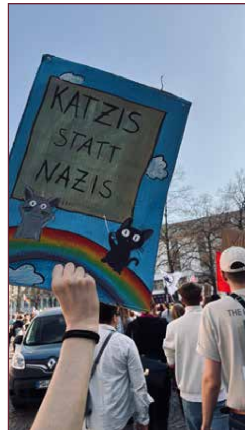
Slogans zum Schmunzeln wurden auf selbst gefertigten Plakaten gezeigt.

Von Heidelbergs 15 Stadtteilen gewannen DIE GRÜNEN 13 davon. Lange Gesichter machten die